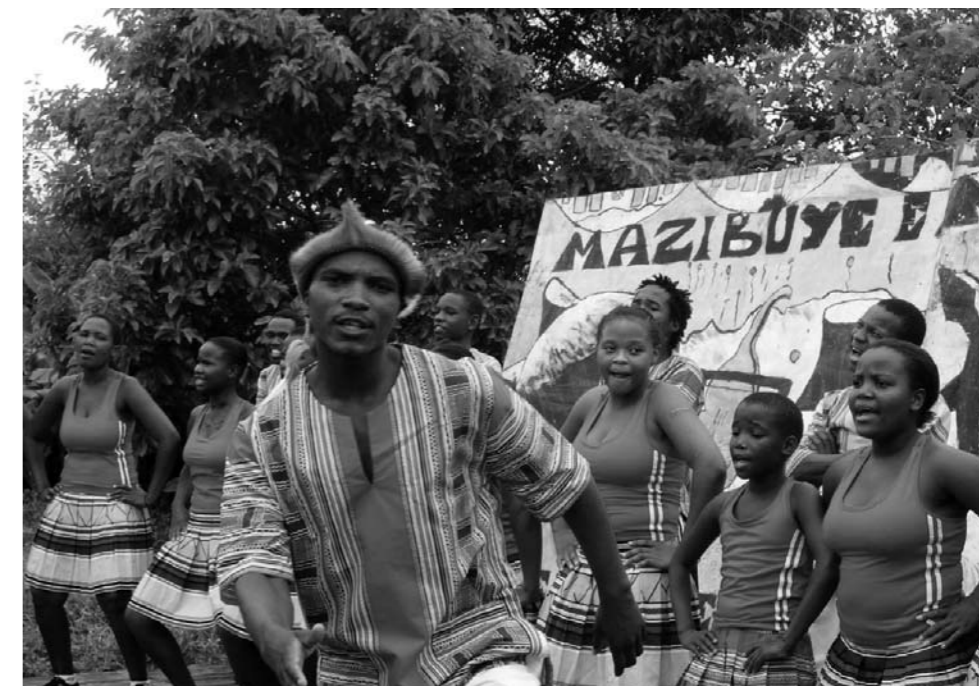
Dansegruppe etablert av Khulisa, SAIHs partner

Kostnadane med å studera varierer mykje frå universitet til universitet. Til liks med Europa og USA er det knytt prestisje til å studera ved dei mest kjende universiteta, og då vert det nok oftast lomdeboka som set grensene. Til skilnad frå Noreg er det til dels store studieavgifter, men til liks med Noreg har også staten i Sør-Afrika støtte- og låneordningar. Utdanning, særleg for svarte, er eit uttalt satsingsområdet for regjeringa.