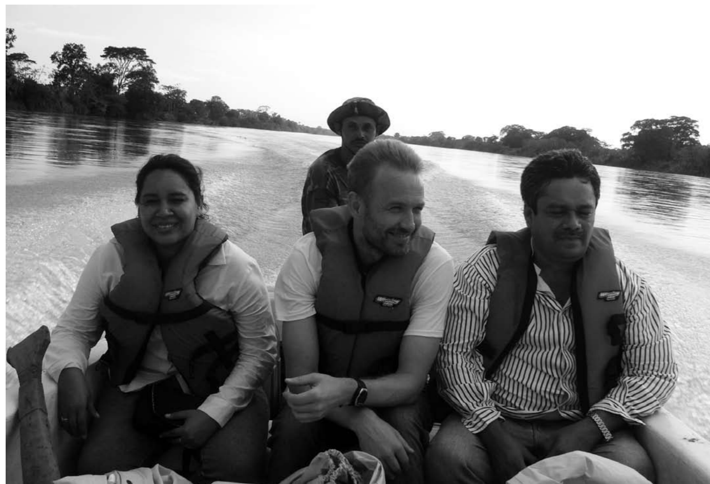
Med Acción Medica Christiana oppover Rio Coco nord i Nicaragua