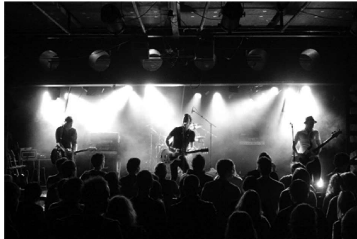
John Doe spiller på "Takk for tierne-konserten" på Betong som avslutning på kampanjeuka