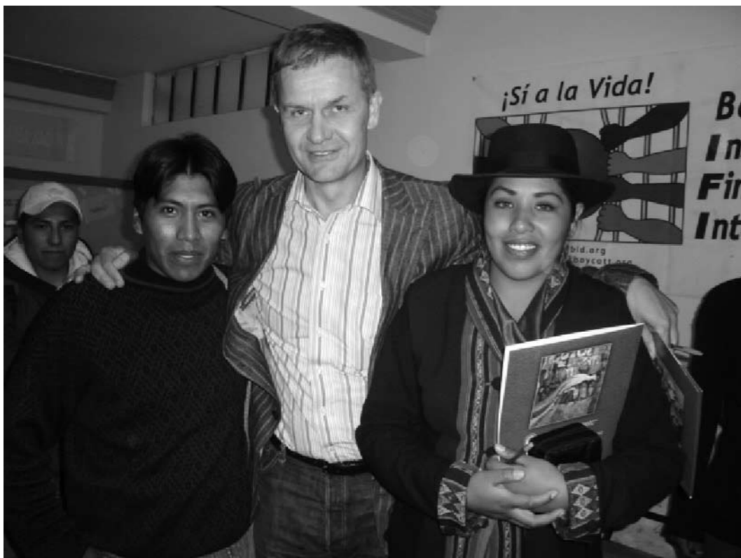
Utviklingsminister Erik Solheim på besøk hos CEADL i El Alto

Prosjektene vi støtter er samlet tematisk i ulike programmer. SAIH fikk i år innvilget rammeavtale med Norad for de neste tre årene for programmene "Utdanning for styrking av urfolks- og minoritetsrettigheter", "Utdanning for frigjøring fra hiv/aids" og "Utdanning til deltakelse og sosial mobilisering i Zimbabwe". Det fjerde programmet, "Utdanning for frigjøring fra vold", er støttet med midler fra Operasjon Dagsverk-kampanjen 2004 samt fra FOKUS (Forum for kvinner og utviklingsspørsmål). Tiltene på programmene er ment å synliggjøre at SAIH driver bistand basert på rettigheter, og at frigjøring er målet med arbeidet vårt.