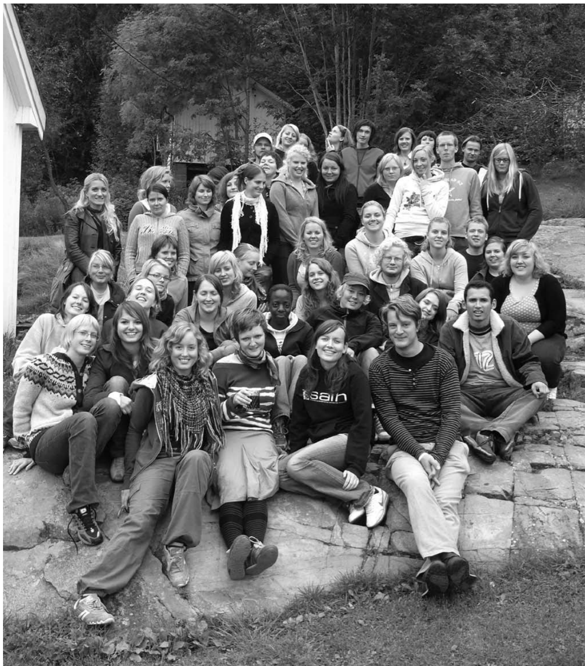
Høstseminar på Nesodden 2006