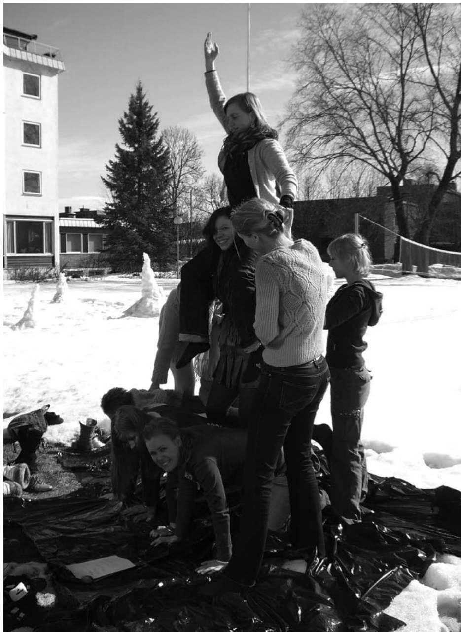
Hinderløype under Vårsamlinga

Styrking av høyere utdanning som kampanjetema var en videreføring av det politiske arbeidet som er blitt drevet av SAIH tidligere, med spesielt fokus på økt bistand til høyere utdanning.